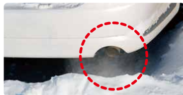
マフラーが塞がれないように除雪

冬 防寒対策が不足すると、低体温症などの恐れがあります。また、積雪によりマフラーが塞がれてしまうと、一酸化炭素中毒の心配がありますので、ご注意ください。