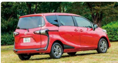
傾斜地での駐車は避けましょう

込まれ、津波や水害から逃げる事ができなくなることがあります。避難時は周囲の状況に応じ、落ち着いて判断しましょう。被災時に適切な場所を探すのは困難です。一部の自治体では車中泊用の避難場所を設けていますので、確認しておきましょう。