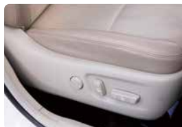
パワースイッチを操作