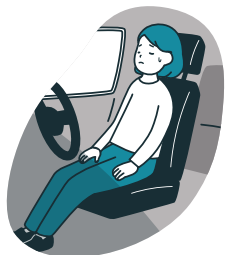
クルマの中や避難所などで長時間同じ姿勢が続く

食事や水分を十分に取らない状態で、車などの座席に長時間座っていて足を動かさないと、血行不良が起こり血液が固まりやすくなります。その結果、血の固まり（血栓）が血管の中を流れ、肺に詰まって肺塞栓などを誘発する恐れがあります。