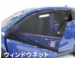
ウィンドウネット