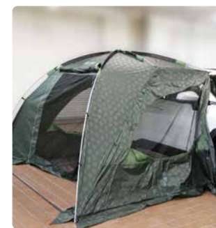
タープと車を連結