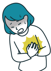
足の血栓が血流に乗って、肺の血管を閉塞させる