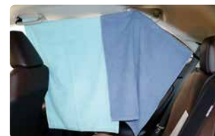
タオルを掛けて目隠しに