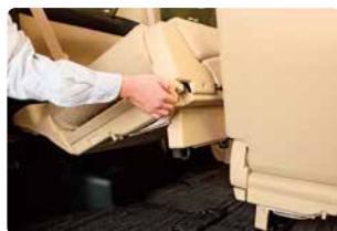
3列目シートを跳ね上げる

3列目の収納が必要な場合がありますが、収納方法は車種によって異なるため、確認しておいてください。