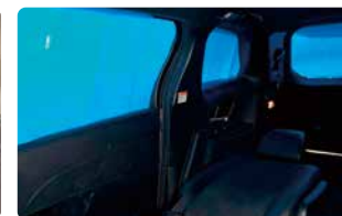
銀マットをカットし窓にはめた例