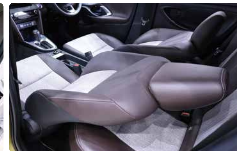
手前:ヘッドレストを反転した状態