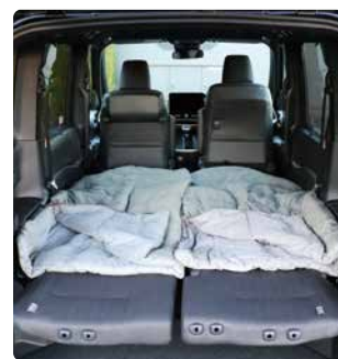
アウトドア用寝袋を利用