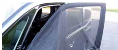
ウィンドウネット装着例(換気、防虫対策)

夏 車内の温度は急速に上昇し、熱中症のリスクが高まります。日陰や換気を心掛け、定期的な水分摂取を行い、無理な避難は継続しないでください。窓を開けると、犯罪や害虫被害の心配があるため、注意が必要です。