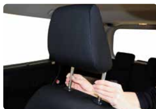
ヘッドレストを取り外す

連結するシートのヘッドレストを取り外し、背もたれシートを最大までリクライニングさせます。さらに座面をスライド固定し連結させてください。