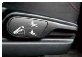
左右にスライドするシートもあり