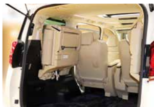
3列目シートを収納