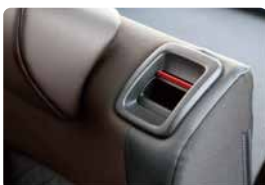
シートの肩のレバーを引く

後席背もたれを前に倒すため、レバー操作が必要ですが、レバー位置は車種により異なります。背もたれシートの肩位置やシート横レバーでの操作が多いですが、操作方法が多彩なため普段から確認しておいてください。