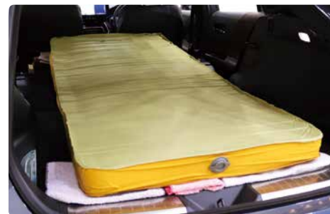
アウトドア用マットを使用

後席を倒したラゲージ利用の際には床面の硬さに加え、後席の傾斜やラゲージとの段差、連結部の溝などが生じるケースがあります。アウトドア用マットやエアーマットなどを用意しておく、ラゲージの硬さや軽度の傾斜、段差をカバーする事が出来ます。