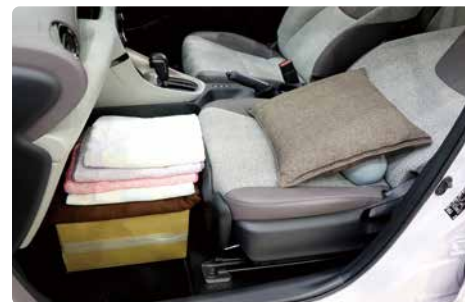
足元:ダンボールとタオルで高さを調整 シート:凹み部分にクッション

ヘッドレストは一度抜いて反転し差し込むと就寝しやすくなります。(一部車種は非対応)