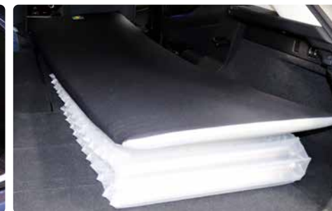
後席に傾斜があるためエアーマットを一部二重にして使用