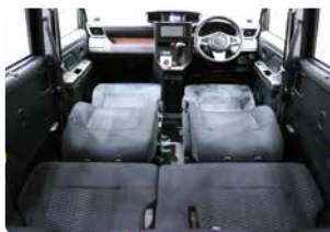
背もたれシートを最大までリクライニング