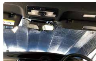
サンシェードで目隠し

車用の目隠しカーテンも販売されていますが、ウィンドウサイズは様々です。銀マットなどをカットして用意しておく、遮光や防寒対策にもなります。