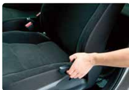
手動レバーを引く

一般的にシートを前後させるスライドレバーは、シート下や横にあり、一番後ろまでさげます。背もたれのリクライニングレバーもシート横にあり、一杯まで倒してください。